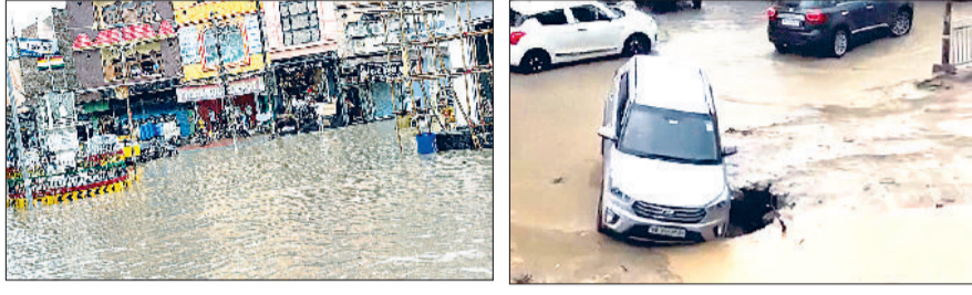
सिरसा। शहर की सड़कों पर जमा हुआ बरसाती पानी तथा गड्ढे में फंसी एक कार।

शहर की सड़कों पर तीन से चार फुट जमा हुआ पानी