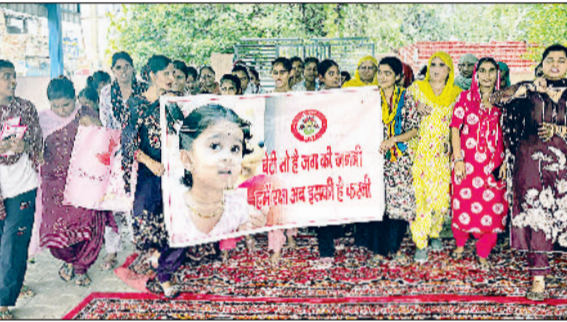
सिरसा। बेटी बचाओ-बेटी पढ़ाओ के प्रति जागरूक करते हुए महिलाएं।