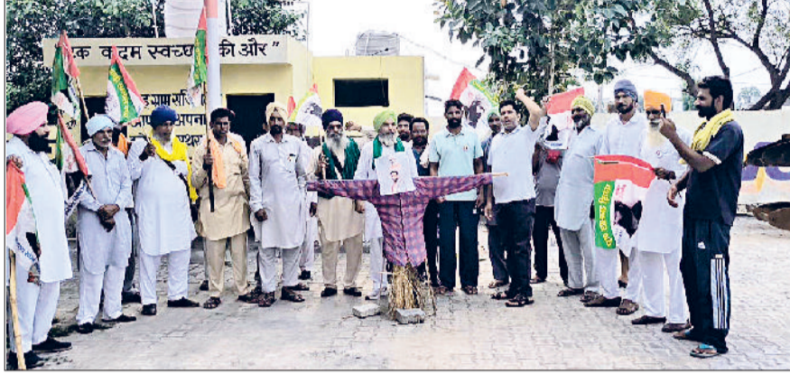
टोहाना। प्रदर्शन कर पुतला फूँके किसान।