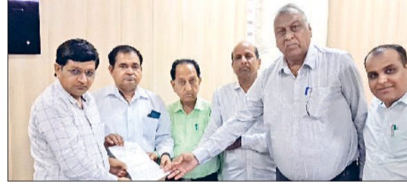
रतिया। एसडीएम को ज्ञापन सौंपते प्राइवेट स्कूल संघालक।