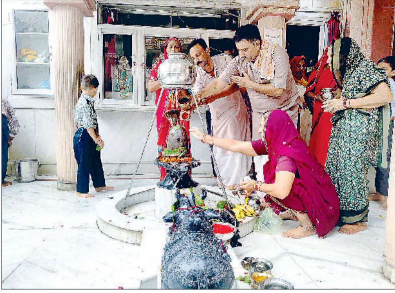
फतेहाबाद। श्री श्याम मंदिर में शिवलिंग पर जलाभिषेक करते श्रद्धालु।