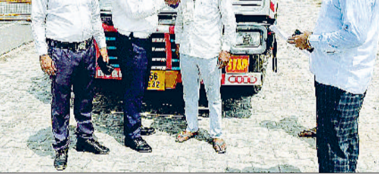
फतेहाबाद। वाहन चालकों की चैकिंग करते ट्रैफिक पुलिस कर्मचारी।